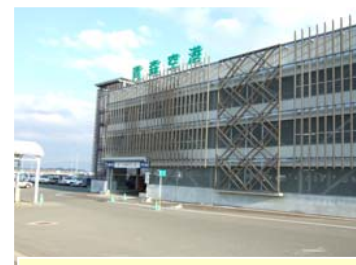
駐車場外壁を「こぎん刺し」の模様をイメージした斜めルーバーなどで覆い やわらかな印象を表現しています