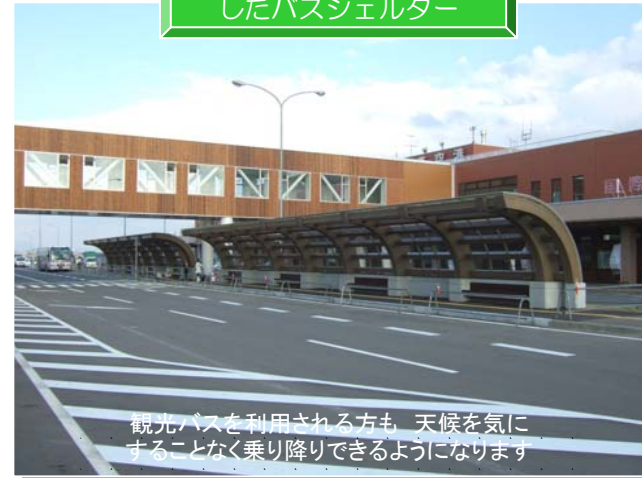
観光バスを利用される方も、天候を気にすることなく乗り降りできるようになります