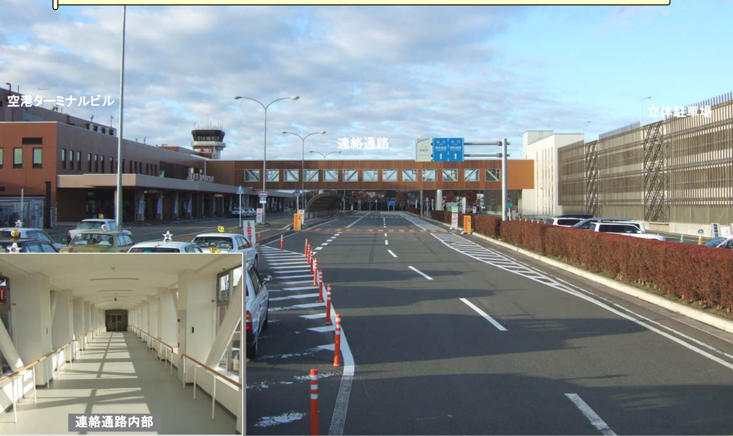
空港ターミナルビル