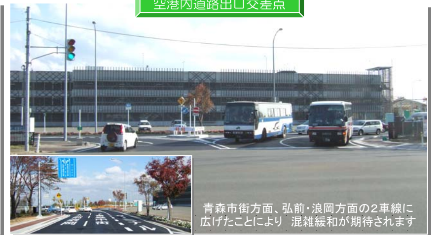
青森市街方面、弘前・浪岡方面の2車線に広げたことにより 混雑緩和が期待されます