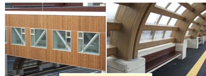
連絡通路の外壁やバスシェルターにヒバやスギなどの県産木材を積極的に活用しています