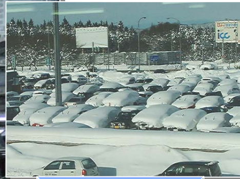
これまでの冬の駐車場